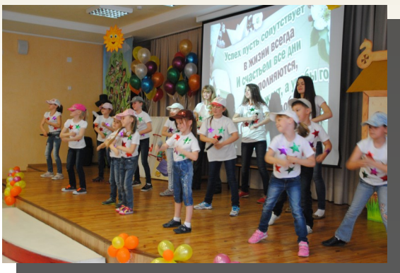
Попурри на школьную тему в подарок всем