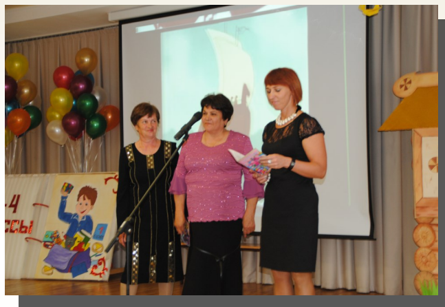
Напутствие от первых учителей