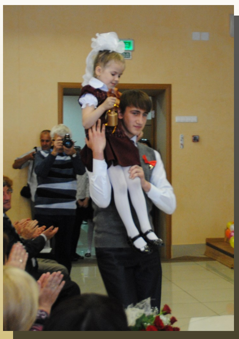
Последний звонок в школьной жизни, пер- вый—взрослого пути