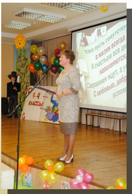
Теплые слова из сердца школы