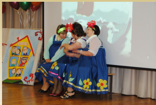
Три девицы под окном пели песни вечер-